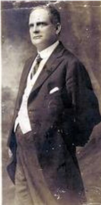
Don Leonardo Falquez Casola

Al igual que todas las mañanas, el Alcalde de Barranquilla, Don Leonardo Falquez, se dispuso a leer la prensa del día mientras apuraba su desayuno y encendía el primero de sus veinte cigarrillos diarios Lord Salisbury.