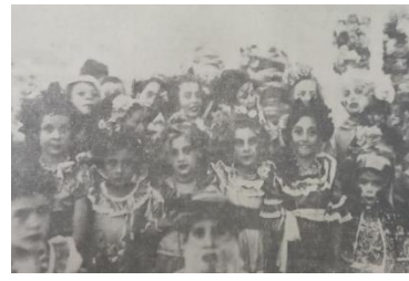
Niños en la Danza del Kongo Chico. Club Barranquilla- 1937

Este proceso de apropiación de lo popular por parte de esa organización social incluyó a los niños vinculados a los socios lo que revela la influencia de la Revista Civilización , en el sentido de que, en los niños “residen la fuerza y la grandeza de la sociedad futura”