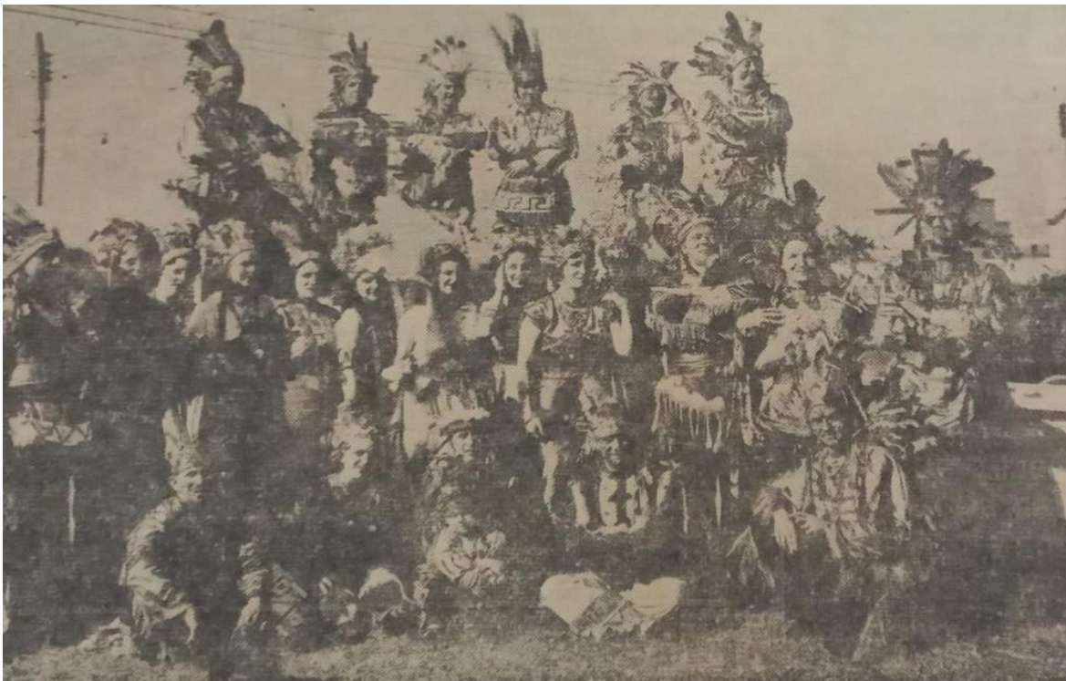
La Danza de los Caciques del Country Club 1937

Esa noche, “ otras comparsas como la de “ Las Indias ” bailaban y reían. “ Los Caníbales ”, ante la ovación recibida se tornaron mansos, dispuestos siempre a la diversión. Bien por “ Los Caciques ” que, como siempre, se distinguieron por el esplendor de su fiesta ”