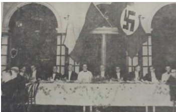
Banquete de honor a la Oficialidad del “Schleswig Holstein”

En esta temporada carnavalera de 1937 , Barranquilla se sentía una Ciudad Marinera.