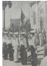
Honores al Libertador tripulación del “Gotland”