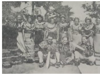
Miembros de la Aristocrática Danza del Kongo Grande. Club Barranquilla- 1937.