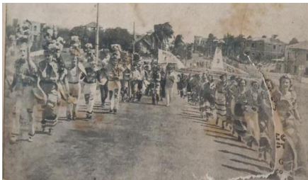
Miembros del Club Barranquilla Caracterizando la Danza del Congo Grande- 1935

En años posteriores- 1935, 1936- vamos a encontrar ese tipo de “juegos de carnaval” al interior del Deutscher Klub y la presencia de Danzas de Negros de Turbante adscritas al Club Barranquilla (Danza de Negros Kongo, Danza del Kongo Grande, Danza del Kongo Chico, Danza del Garabato) calificadas como “aristocráticas”, haciendo visitas de cortesía a Padrinos y Madrinas en el Barrio El Prado o haciéndose fotografiar luciendo sombreros en lugar de turbantes.