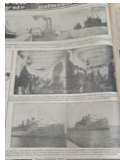
Arribo del “Prince David”