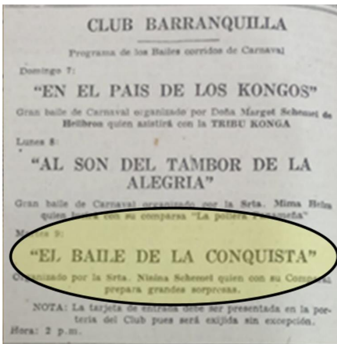
El Baile de La Conquista Club Barranquilla