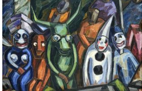
Carnaval y entierro Fragmento