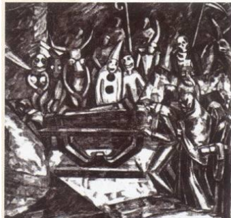
Carnaval y entierro Proyecto Completo