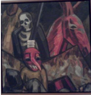
Carnaval y entierro Fragmento.